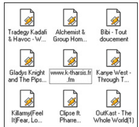
Les fichiers mp3, bête noire de l'industrie du disque