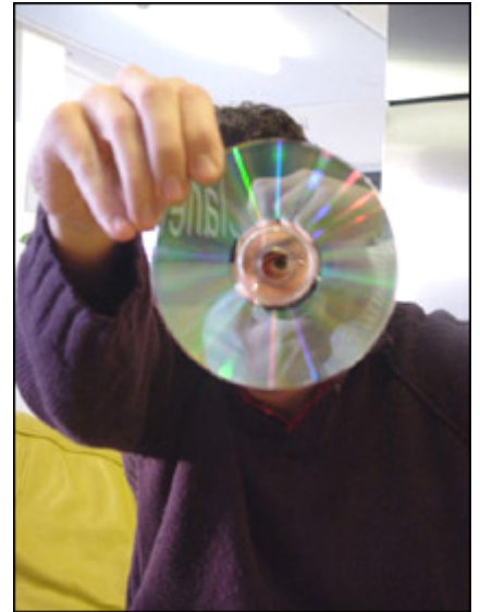
Deux ans d'emprisonnement et 150 000 € d'amende, c'est le prix à payer pour un pirate.

Réduire à néant le téléchargement illicite sur Internet demeure le cheval de bataille des défenseurs de la propriété intellectuelle. Selon la Fédération Internationale de l'Industrie Phonographique (IFPI), 99% des fichiers musicaux présents sur le net en 2001 étaient illégaux. 1000 serveurs d'échanges de particuliers à particuliers (peer to peer) ont été fermés, tandis que d'autres ont dû se plier aux règles du droit d'auteur, comme audiogalaxy.com, ex-corne d'abondance musicale